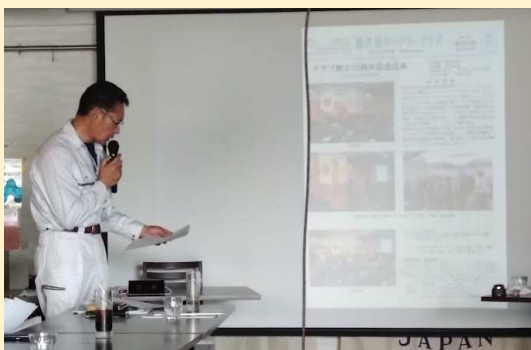
50周年記念式典の事業説明

60周年記念例会の概要を討議の上、認識して頂き次年度の準備に入るため概略の仮決めを行いました。