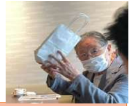
地区大会長寿会員表彰